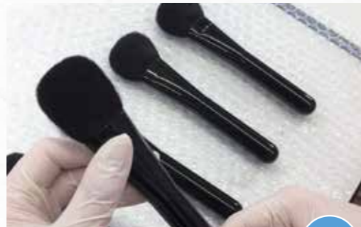
人気の熊野筆が館内で体験! 館内体験

支配人おすすめ! 時期……… 6月初旬～下旬(大玉は6月中旬) 料金……… お1人様1,200円(梅2kg) 所要時間……… 30～60分 場所……… 尾道(ホテルより60分) 最小催行人数… 10名様 最大300名様まで 特典……… 梅林特製ドリンクサービス