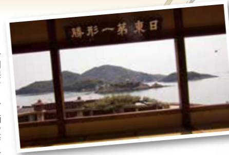
対潮楼から見る鞆の海は、「日東第一形勝」と称されました。