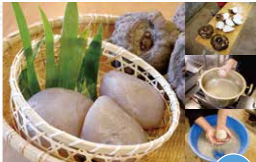
魅力の神石高原産とのコラボ企画 館内体験