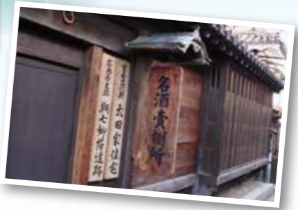
太田家住宅周辺や常夜灯でも、ロケが行われました。

潮待ち風待ちの港として、万葉集にも歌われた鞆の浦。古の町並を今も残す情緒豊かな町は、しばしば映画やドラマ等の舞台にもなっています。あなたも往時に心をのびさせて、鞆の街並みを歩いてみませんか。